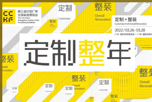
定制“整”年 趋势探讨论坛

多场权威论坛，齐聚定制家居优质代表企业专家及优质供方领军人，共同商榷行业发展未来。