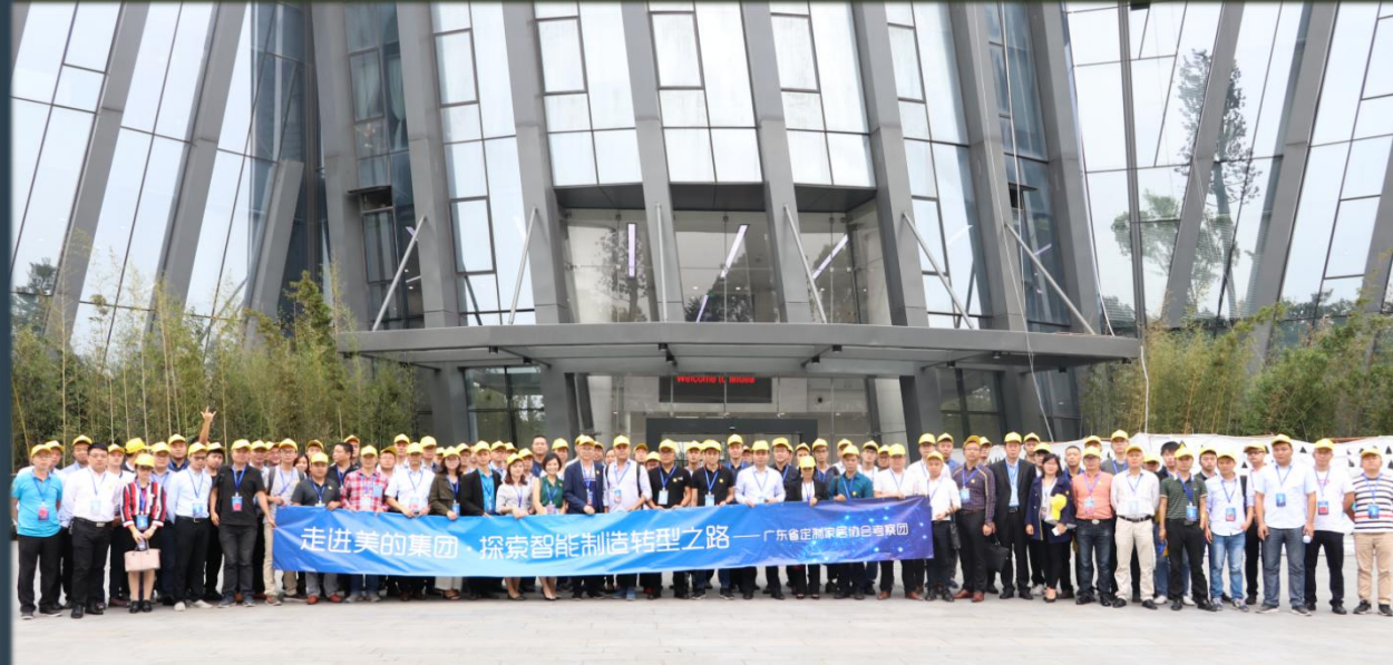
2020中国定制家居产业链趋势峰会