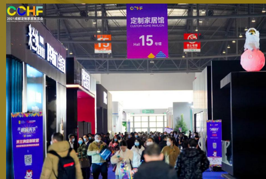
“高定热”主 题探讨论坛