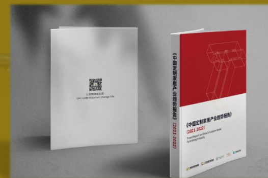
中国定制家居产 业趋势报告发布