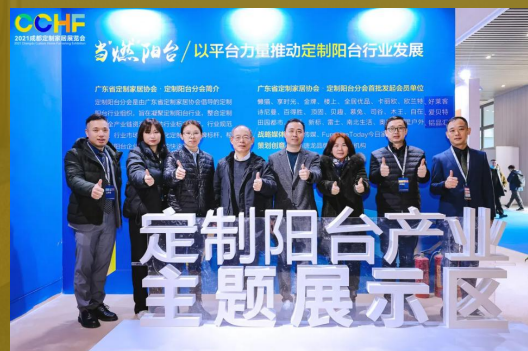
定制企业入口前置 主题论探讨坛